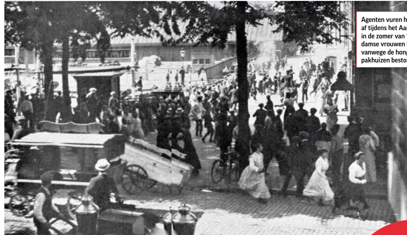
Agenten vuren hun revolvers af tijdens het Aardappeloproer in de zomer van 1917. Amsterdamse vrouwen hebben vanwege de honger voedselpakhuisen bestormd.

Er werd openlijk geadverteerd voor vuurwapens, zelfs in socialistische weekbladen, zoals De Volkstribuun . Daarin werden 'socialistische meisjes' in 1893 aangespoord om een revolver als 'St. Nicolaas-Kadeautje' voor hun vrijer te kopen. Bestellen kon gewoon per postwissel, zoals tegenwoordig in een webshop, zonder verdere voorwaarden. Overigens waren deze advertenties in socialistische kringen niet onomstreden. Zo was de directeur-uitgever H.J. Poutsma