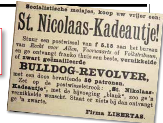
Advertentie uit De Volkstribuun , 1893.

Wapenbezit is nog altijd toegestaan voor beoefenaren van de schietsport.