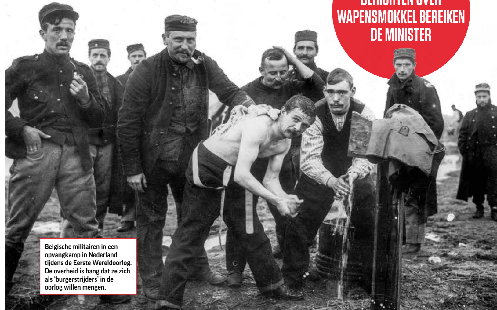
Belgische militairen in een opvangkamp in Nederland tijdens de Eerste Wereldoorlog. De overheid is bang dat ze zich als 'burgerstrijders' in de oorlog willen mengen.

DREIGT ER EEN REVOLUTIE? BERICHTEN OVER WAPENSMOKKEL BEREIKEN DE MINISTER