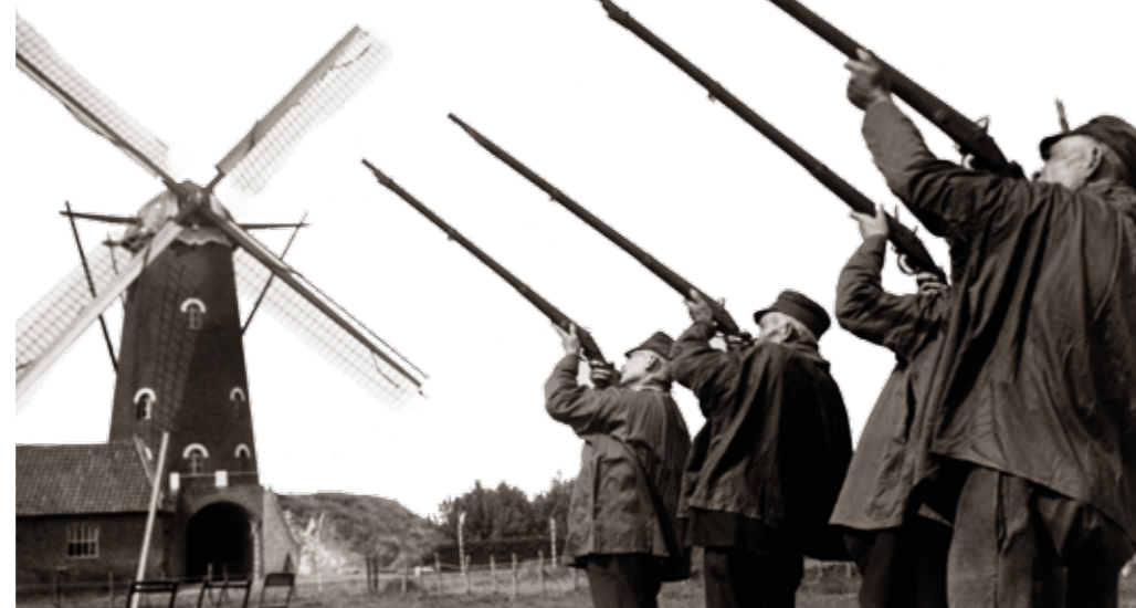
Schutters van het Limburgse St. Georgiusgilde, 1936.

arbeiders soortgelijke revolvers en zoo zij bij toeval soms een gendarme raakten, ging de getroffene even bij z'n dokter, die de kogel er uit haalde, 'n verbandje omlegde en de man was onmiddellijk weer voor den dienst gereed.' Ondertussen ontstond het besef dat vrij beschikbare vuurwapens 'bedenklijk' waren in handen van 'misdadigers, zieken van geest en kinderen', terwijl bijvoorbeeld de verkoop van gif wel allerlei beperkingen kende. Maar vooral de toenemende dreiging van revolutionair geweld en de ontwikkelingen aan de landsgrenzen waren aanleiding tot strengere wetgeving.