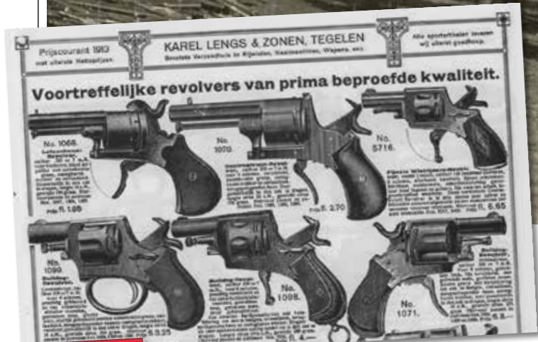
RECLAME UIT 1913