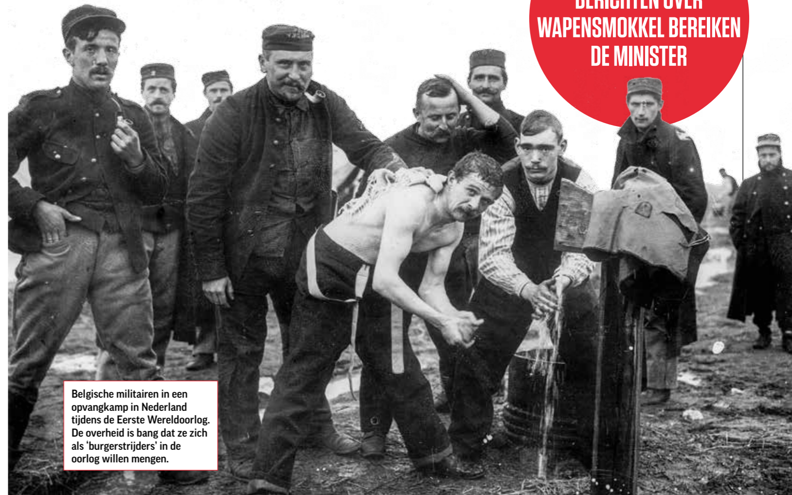
Belgische militairen in een opvangkamp in Nederland tijdens de Eerste Wereldoorlog. De overheid is bang dat ze zich als 'burgerstrijders' in de oorlog willen mengen.

DREIGT ER EEN REVOLUTIE? BERICHTEN OVER WAPENSMOKKEL BEREIKEN DE MINISTER