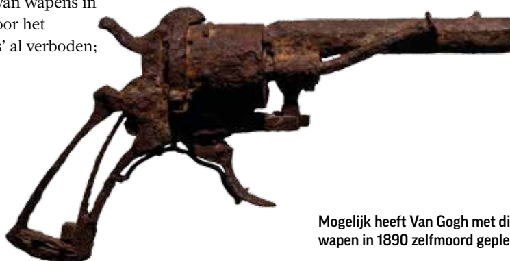
Mogelijk heeft Van Gogh met dit wapen in 1890 zelfmoord gepleegd.