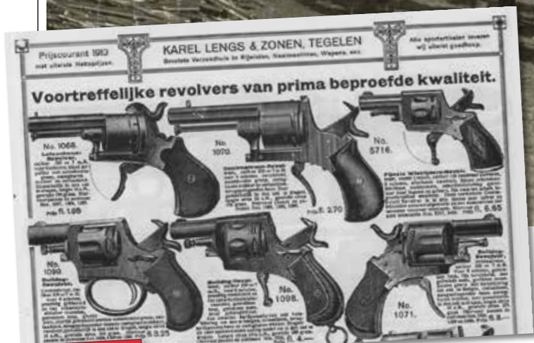
RECLAME UIT 1913